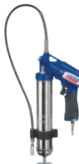
PowerLuber neumática Modelo 1162-E