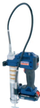
PowerLuber de iones de litio de 20 V Modelo 1882-E

La familia PowerLuber de Lincoln incluye toda una gama de pistolas de engrase operadas con batería e incluye herramientas impulsadas por NiCad e iones de litio, así como opciones neumáticas y eléctricas. Desarrollada por expertos en lubricación, la gama PowerLuber tiene la pistola de engrase adecuada para sus necesidades.