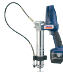
PowerLuber de NiCad de 18 V Modelo 1842-E