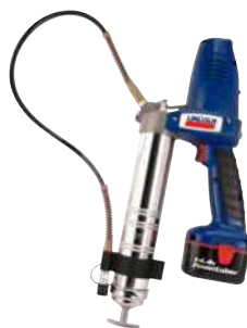
PowerLuber de 14 V Modelo 1442-E