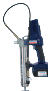
PowerLuber de iones de litio de 18 V Modelo 1862-E