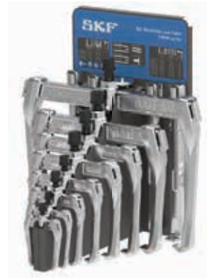
TMMR 8XL/ KÉSZLET