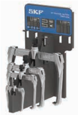
TMMR 4F/ KÉSZLET