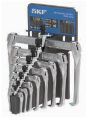
TMMR 8F/ KÉSZLET