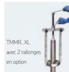
TMMR.XL avec 2 rallonges en option

Vos fiches de montage gratuites sur www.skf.com/mount