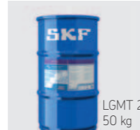
LGMT 2 50 kg