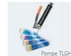
Pompe TLGH 1