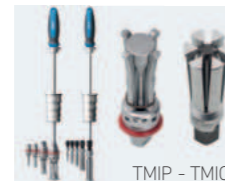
TMIP - TMIC