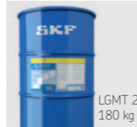
LGMT 2 180 kg