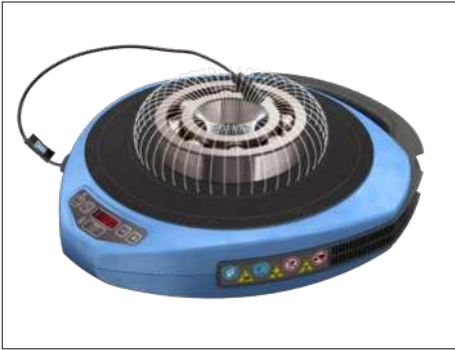
Fig. 1 – Campo magnético ao redor do rolamento

O aquecedor por indução portátil TWIM 15 consiste em uma placa de polímero reforçado com fibra de vidro, resistente a altas temperaturas, e bobinas eletromagnéticas, situadas abaixo da placa. Quando o aquecedor está ligado, uma corrente elétrica passa pelas bobinas e gera um campo magnético oscilante, que não aquece a placa superior em si. Porém, assim que um componente de ferro ou aço inoxidável é colocado sobre a placa, o campo magnético induz muitas correntes elétricas pequenas (correntes parasitas) no metal dos componentes.