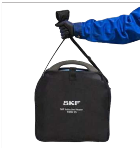
Fig. 3 og 4 – TWIM 15-BAG er ekstra tilbehør til TWIM 15, men inkluderet i TWIM 15K