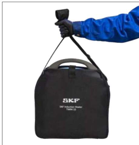
Рис. 3 и 4 – TWIM 15-BAG сумка не является обязательной для TWIM 15 и входит в стандартную комплектацию TWIM 15K