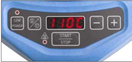
图 2 - 用户界面