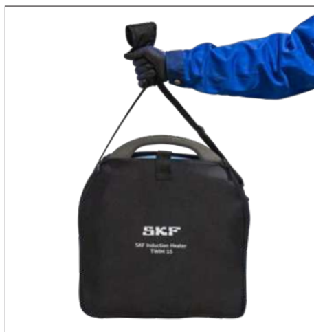
Fig. 3 e 4 – A bolsa TWIM 15-BAG é opcional ao TWIM 15 e incluída como padrão no TWIM 15K