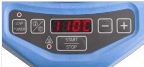
Fig. 2 – Brugergrenseflade