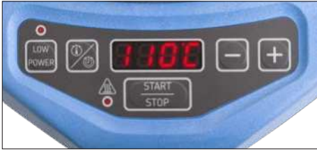
Fig. 2: Interfaz de usuario