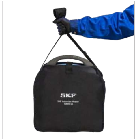
Fig. 3 & 4 – Le sac de transport SKf TWIM 15-BAG est en option pour le TWIM 15 et inclus en standard pour le TWIM 15K