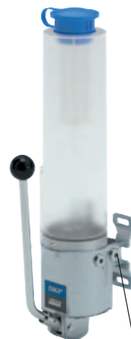
Optionaler Schmierstoffauslass rechts