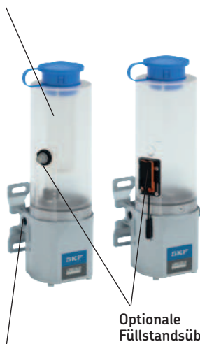
Standard-Schmierstoffauslass mit G1/4-Anschlussgewinde

Ausführungen für Öl werden mit Einfüllfilter ausgeliefert, damit das Öl sauber bleibt