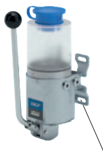
Wandhalter für flexible Montage

Gleiches Montagemuster wie die POE(P) / PFE(P) Baureihe